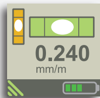
Clara visualización en XT290. Valores y gráficos en tiempo real.

Alinee con valores en tiempo real y documente en formato PDF. (App XT Alignment para iOS y Android. Programa Valores/Nivel).