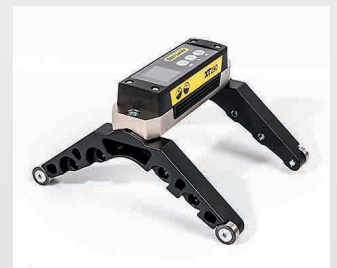
Accesorios para el rodillo de diámetro 55-800 mm. N.º art. 12-0901.

Easy-Laser® es un producto de Easy-Laser AB, Alfagatan 6, SE-431 49 Mölndal, Suecia Tel.: +46 31 708 63 00, Fax: +46 31 708 63 50, Correo electrónico: info@easylaser.com, www.easylaser.com © 2020 Easy-Laser AB. Reservado el derecho a efectuar modificaciones sin previo aviso. Easy-Laser® es una marca registrada de Easy-Laser AB. Apple, el logotipo de Apple logo, iPhone y iPod tocho son marcas comerciales de Apple Inc., registradas en EE. UU. y otros países. App Store es una marca de servicio de Apple Inc. Las demás marcas comerciales pertenecen a sus respectivos titulares. Este producto cumple las siguientes normas: EN60825-1, 21 CFR 1040.10 y 1040.11 FCC ID: Q0QBG13P, IC: 5123A-BGM13P. ID de documentación: 05-0975 Rev1