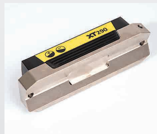
Base prismática rectificada con precisión. Dos orificios para soportes y adaptaciones personales.